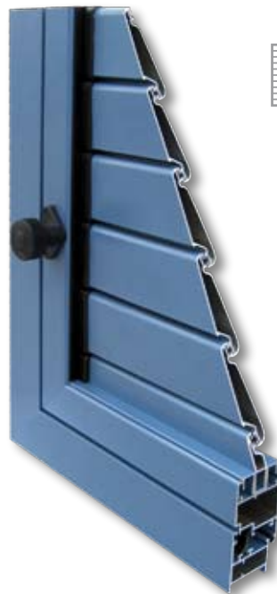
Aperturas Mallorquina C.E.